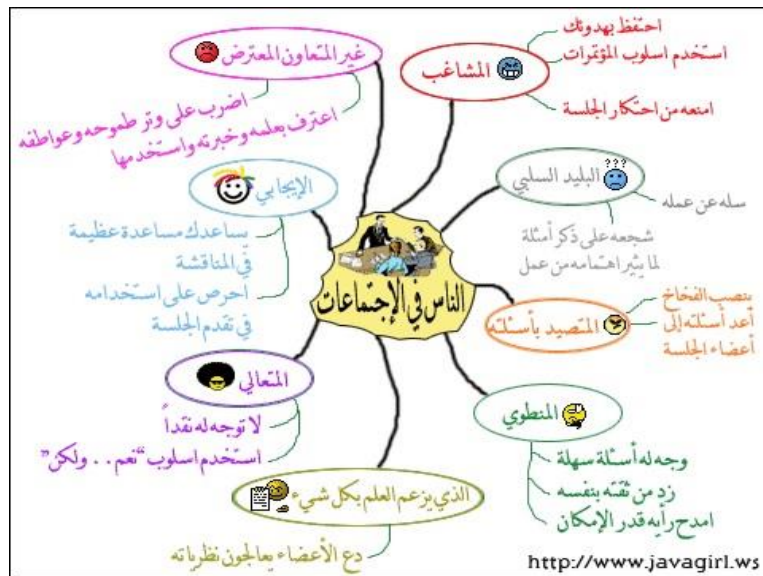
شكل (٢) : خرائط العقل

صممت هذه الخرائط على شكل يشبه عمل العقل عند استقباله للمعلومات على شكل شبكي يقترب من المعلومة او يبتعد عنها اعتماداً على ما لديه من خبرات ترتبط بهذه المعرفة او لا ترتبط بها مطلقاً . ( مدونة بلال )